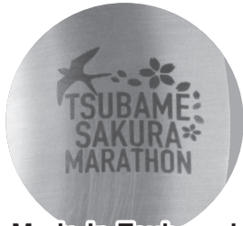
Made in Tsubame! 大会ロゴ入り!

大会当日に出走された方を対象に、アスリートビブス(ゼッケン)番号にて、事前に事務局で抽選会を行います! 当日、総合案内所付近に当選番号を掲示しますので、ご自身の番号があるかご確認ください。 当選された方には「総合案内所」にて景品をお渡しします。